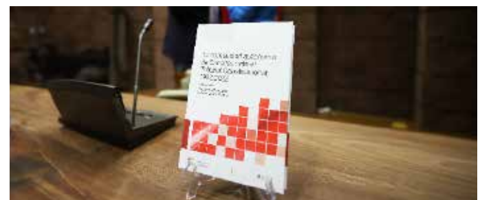
Presentación del libro 'La Comunidad Autónoma de Canarias ante el Tribunal Constitucional'