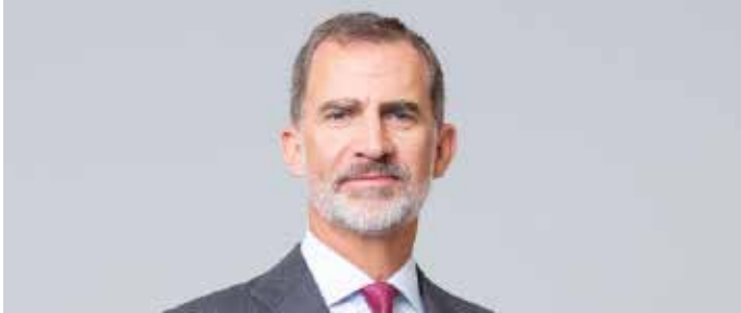
El Parlamento concede su Medalla de Oro a Felipe VI