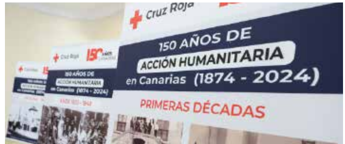
150 años de trabajo de Cruz Roja en el Archipiélago