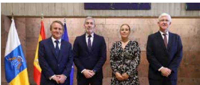
Carlos de Millán y Pedro Pacheco, presidentes del Consejo Consultivo y de la Audiencia de Cuentas

La presidenta de la Cámara, Astrid Pérez, destaca la eliminación de las barreras para la comunicación con más de 55.000 personas con problemas auditivos, el primer vídeo podcast institucional de un parlamento español y la apertura de la institución a más de 50 colectivos y 2.400 visitas en apenas 12 meses