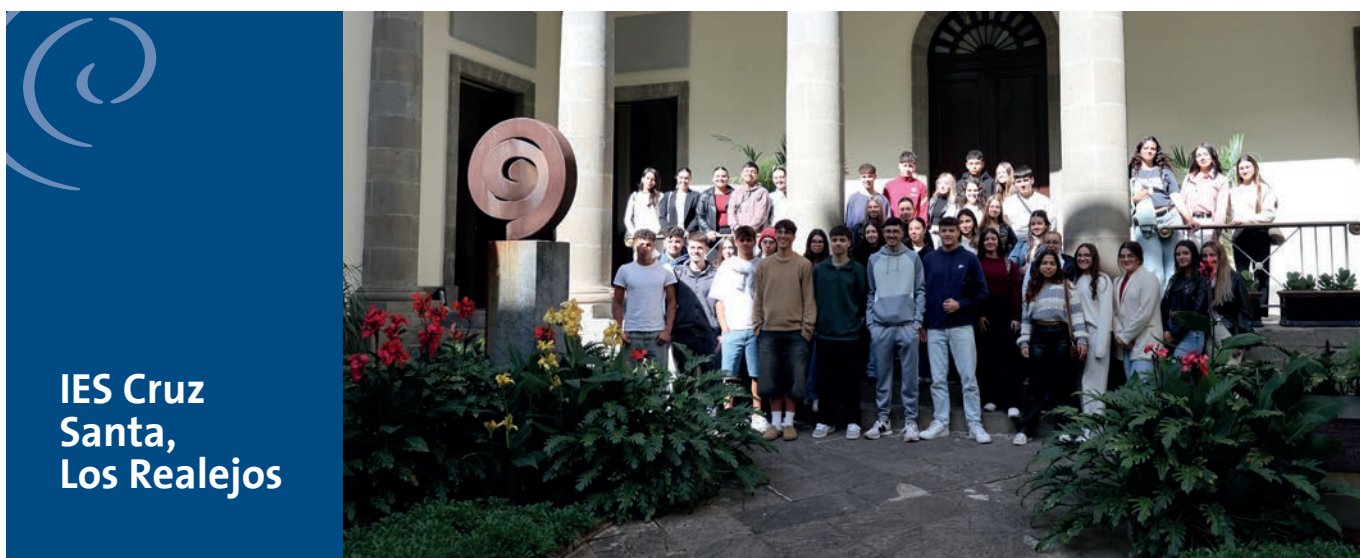
IES Cruz Santa, Los Realejos