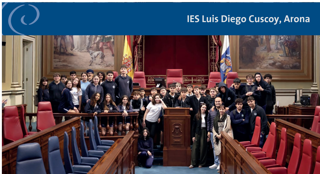
IES Luis Diego Cuscoy, Arona