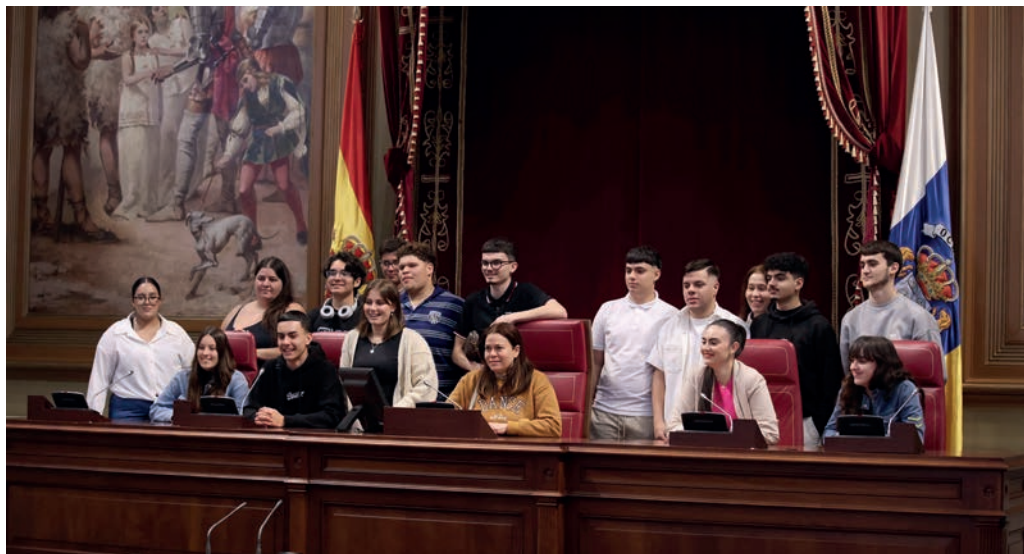
CIFP La Laguna