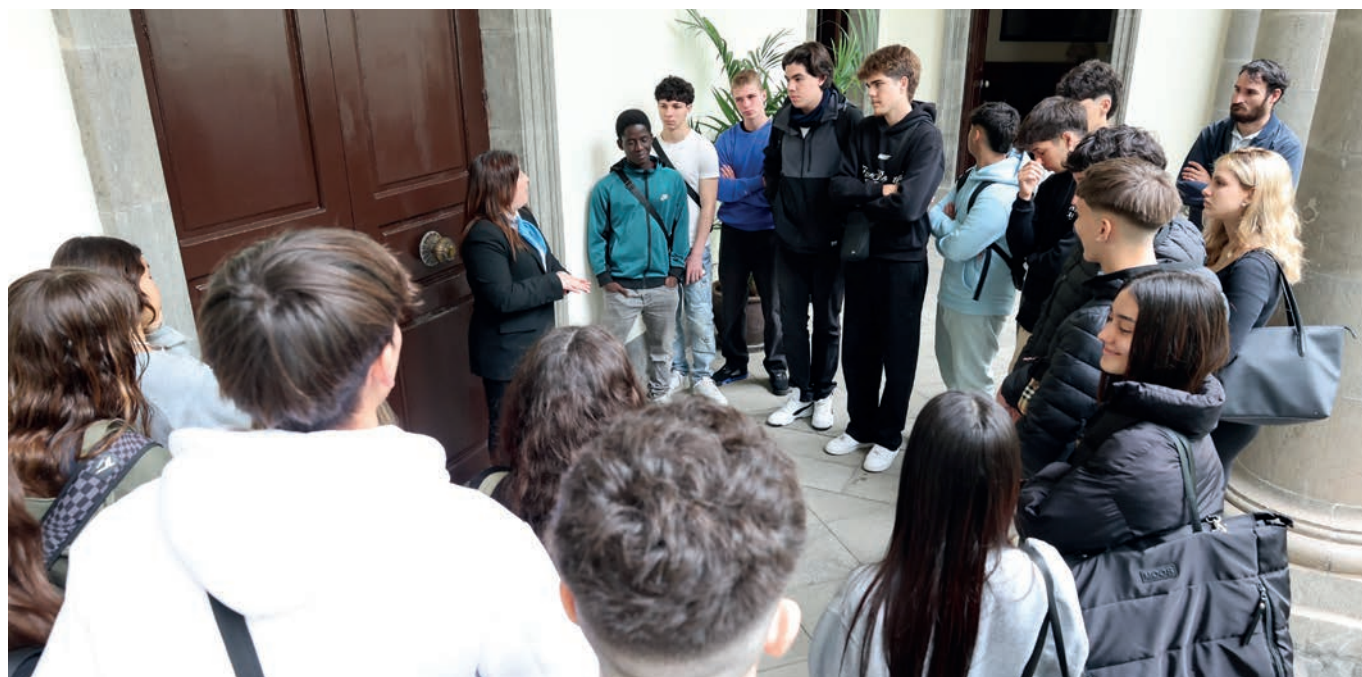
IES Montaña de Guaza, Arona