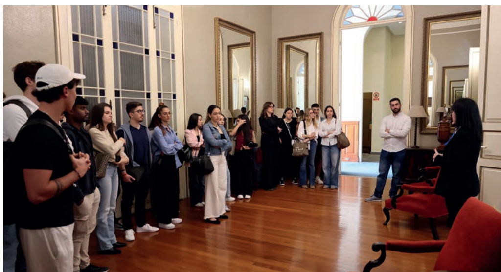
Universidad Europea de Canarias