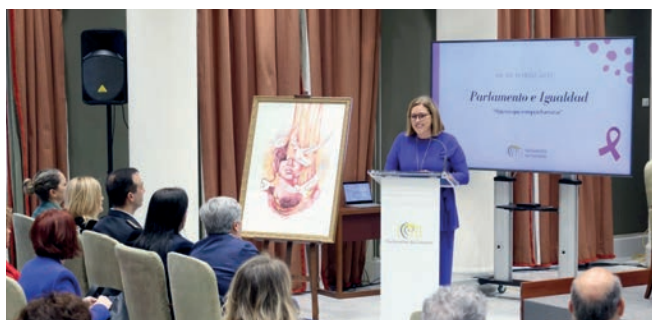
Las mujeres toman la palabra en el Parlamento