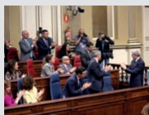
El pleno en imágenes