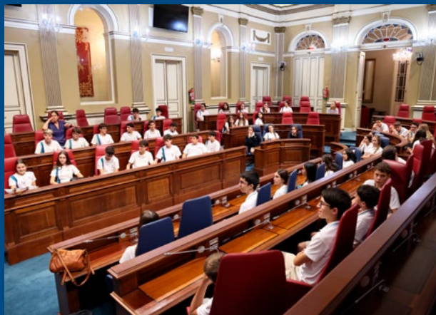
Colegio Pureza de María, de Santa Cruz de Tenerife