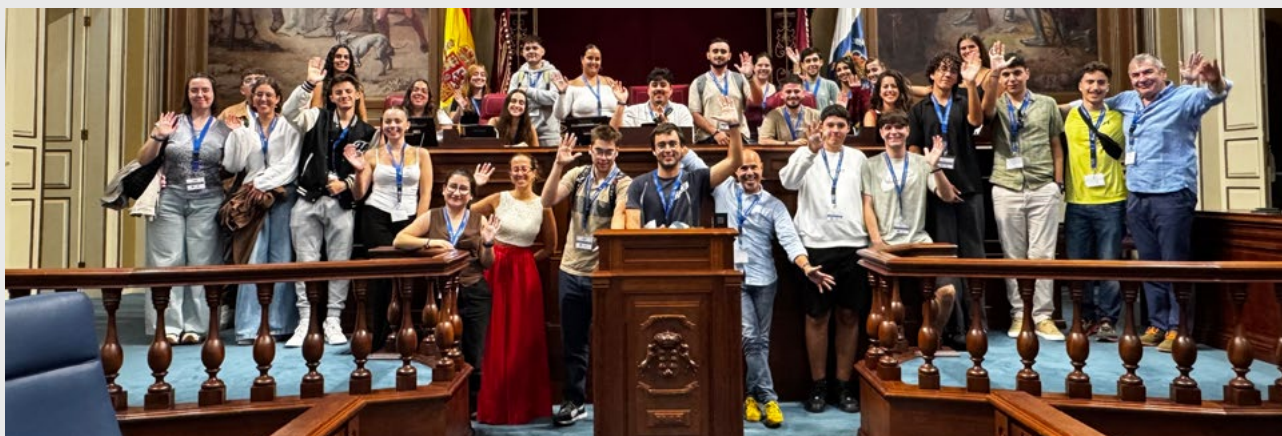
Participantes del proyecto 'Conoce tus Parlamentos'