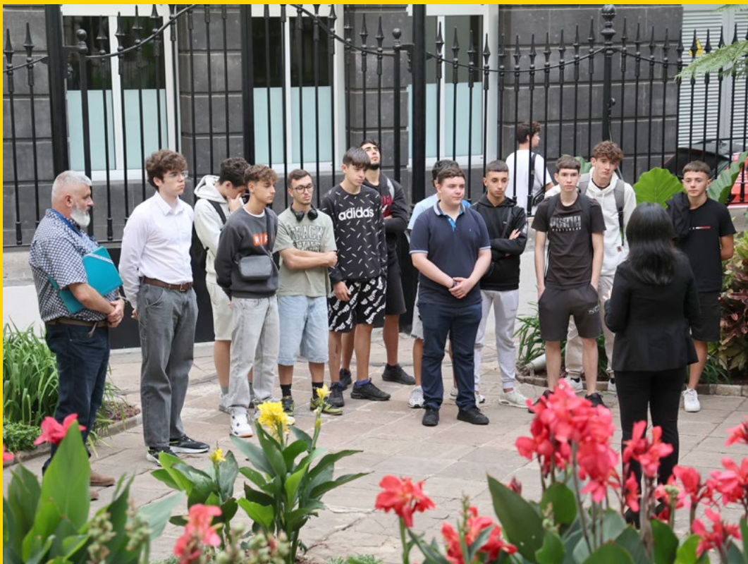
IES San Matías