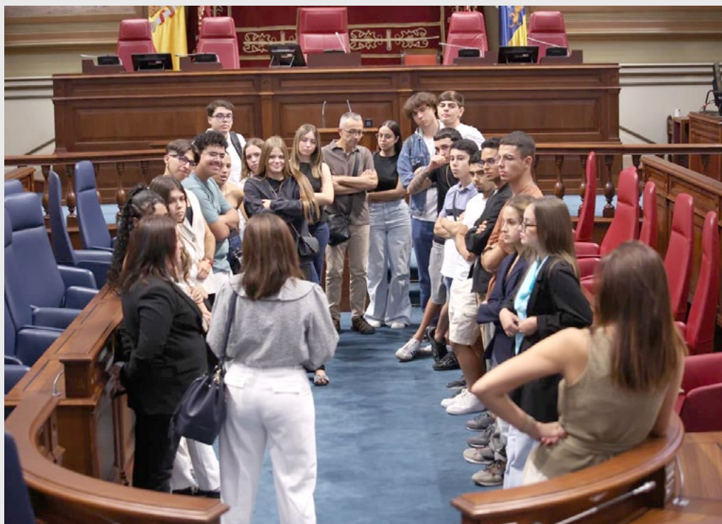
CIFP César Manrique, Santa Cruz de Tenerife