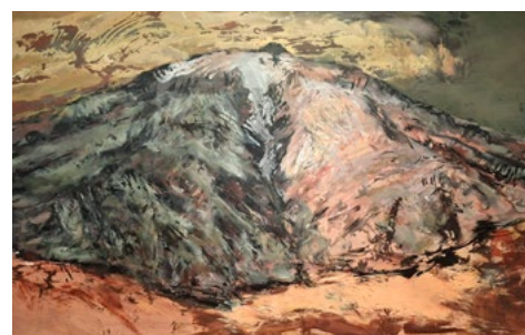
> Obra de arte PEDRO GONZÁLEZ