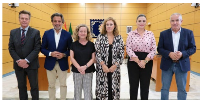
Fuerteventura acoge la reunión de la Mesa del Parlamento de Canarias