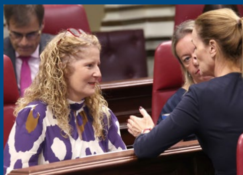
Pleno en imágenes