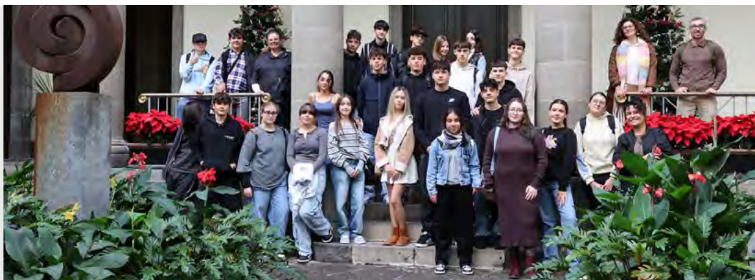
IES El Tanque