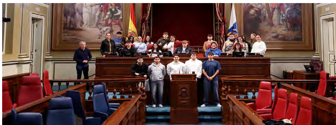
IES Los Realejos