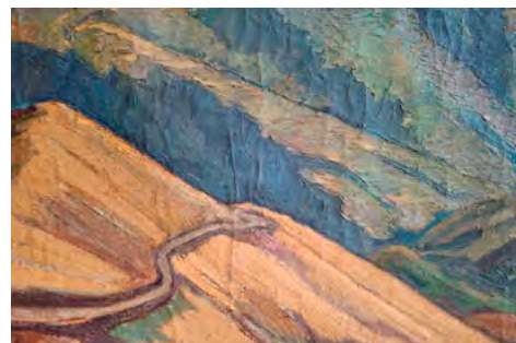
>Obra de arte N-Massieu y Matos