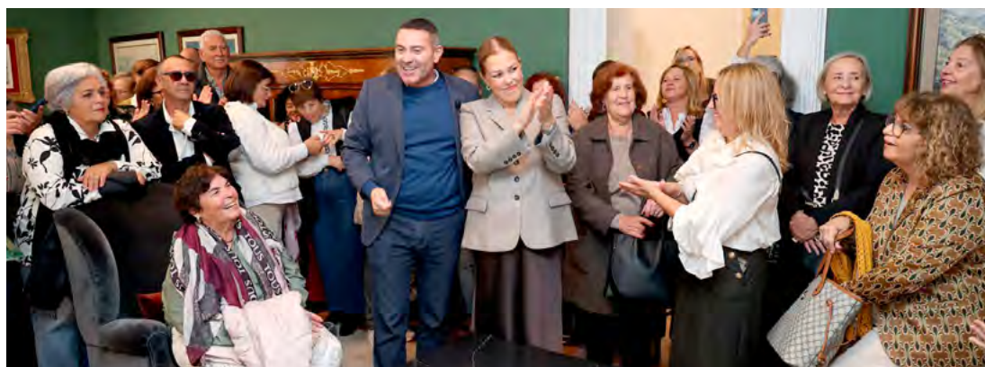
Consejo Insular de las Personas Mayores de Lanzarote y La Graciosa