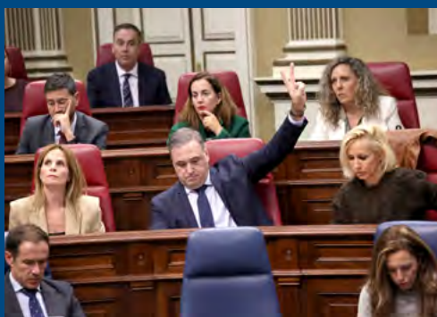
Pleno en imágenes