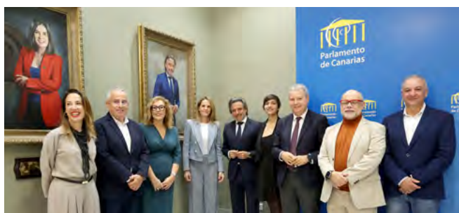
El Parlamento de Canarias presenta el retrato institucional del expresidente Gustavo Matos