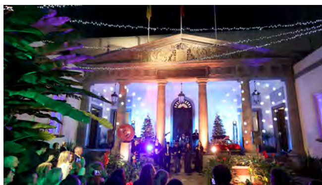
Navidad en el Parlamento de Canarias