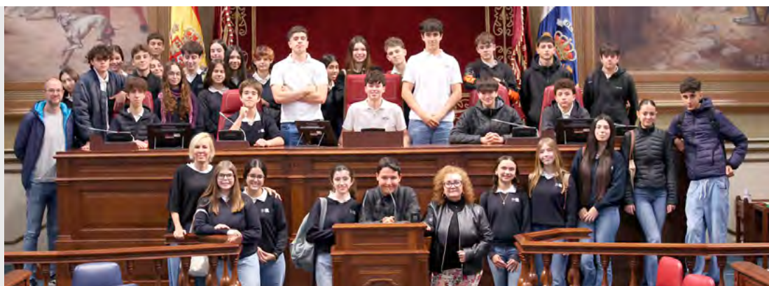
Colegio Buen Consejo, La Laguna